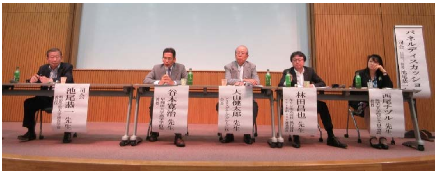
パネルディスカッションでは企業のマーケティング視点から議論