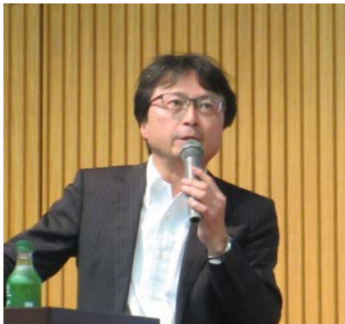
キリンの林田部長は復興支援プロジェクトの経験を語った