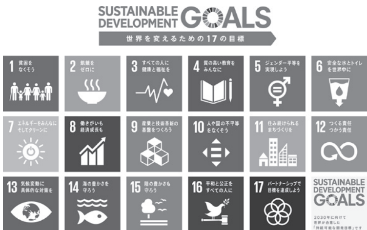
図1 持続可能な開発目標 (SDGs)

連しあっており、個別に切り離して議論できる問題ではない。さらに地球温暖化の問題などは一国政府の枠を超えて広がっており、地球レベルでトータルな視点からの解決が求められている。持続可能な経済的繁栄・安定は、環境保護、社会的課題とともにあり、それは現在の世代のみならず将来の世代も視